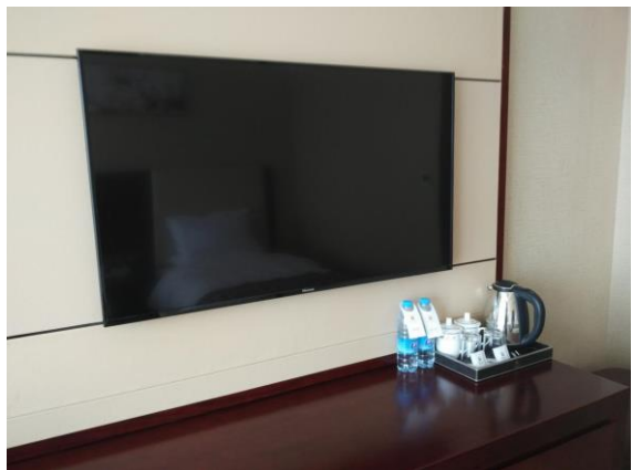
3. 豪华大床、行政大床现场实景图片