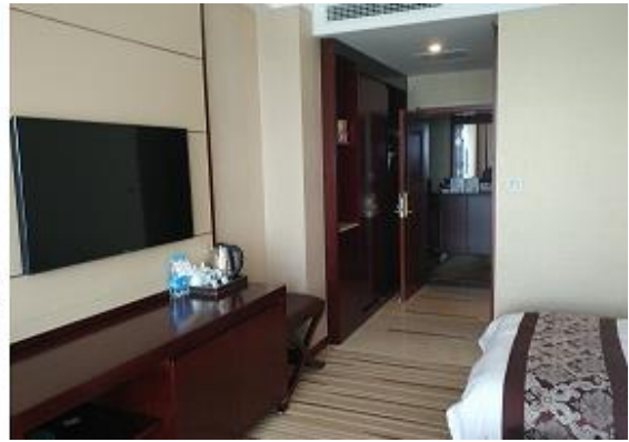
2. 大床房现场实景图片